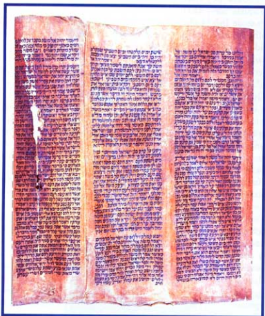
Pergamimbo da Torá de D. Pedro II