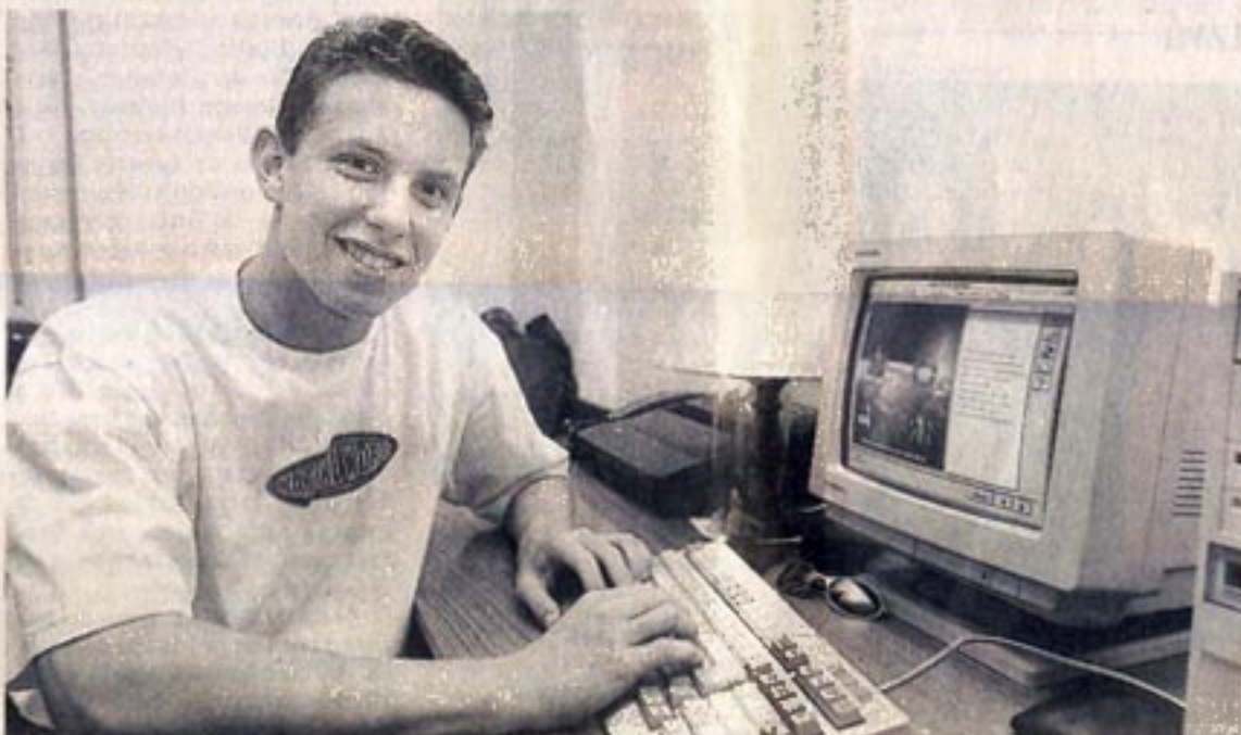
Teclado e monitor fazem parte da rotina dos jovens e adultos ligados na Internet

bléia das Comunidades Judaicas da Europa a B'nai B'rith, a Organização Sionista Mundial e muitas outras organizações israelis são acessíveis hoje na rede.